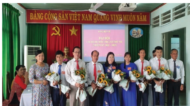
Đại hội chi bộ hệ điều trị-TTYT Bến Cát

đảm bảo an toàn trong phòng chống dịch, đảm bảo an toàn thực phẩm, đảm bảo an toàn cho sức khỏe và sự phát triển toàn diện về thể chất và tinh thần cho học sinh, như: