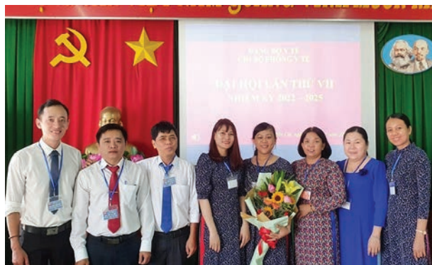
Đại hội chi bộ phòng y tế-TTYT Bến Cát